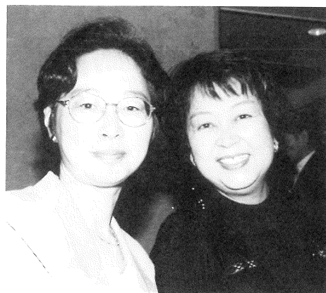
ツーショットは振興会森田副会長(左)と廣澤会長