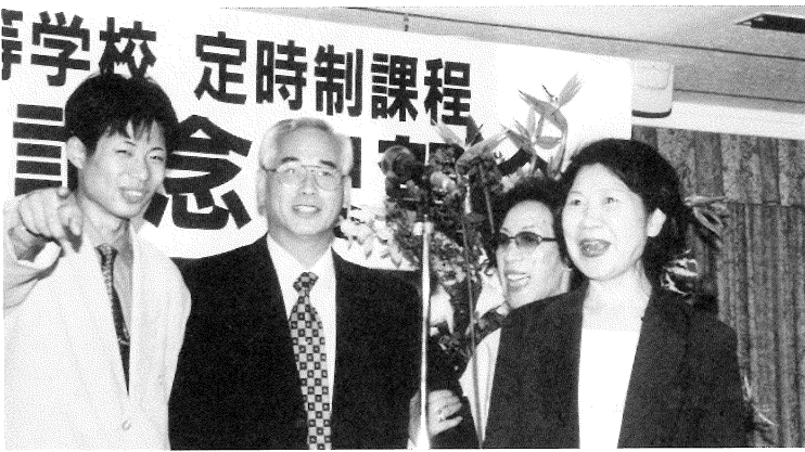
前田前校長と今年卒業の47期生の皆さん