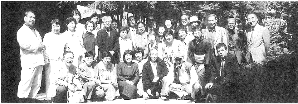
▲ 7期参加者全員 ▼ 18期男性と女性群