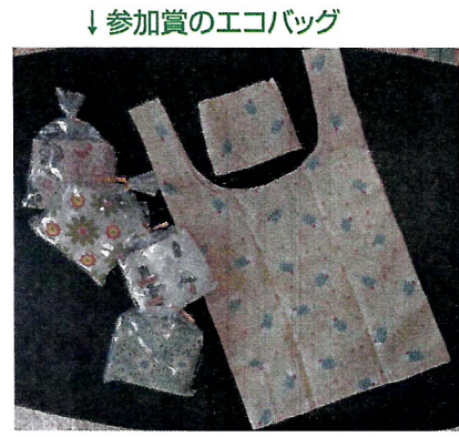
↓参加賞のエコバッグ